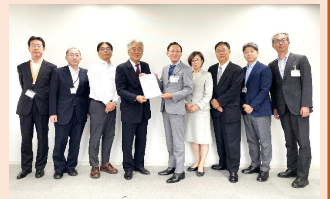
■要望書提出の様子

面会の際は、7月に開催した「81まちづくりフェスタ！2024」の開催報告を行うとともに、補助第81号線の整備等に関する要望書を提出しました。