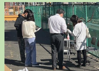
■アンケート調査の様子

また、防災フェス当日に都市づくり公社より配布予定だったハーブ苗について、10月24日（火）に補助第81号線沿道にてアンケート調査にご協力頂いた皆さまへ配布しました。