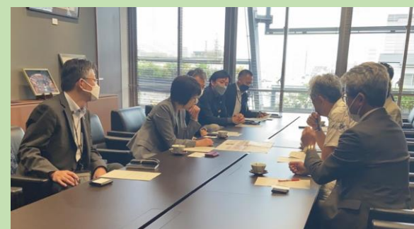
■高際区長との面会の様子

富樫会長より「補助第81号線の早期完成に向け、全力で取り組むこと」「補助第81号線沿道まちづくりの事業実施に向けた支援を行うこと」「東池袋四・五丁目地区の防災まちづくりを推進すること」等を要望し、意見交換を行いました。