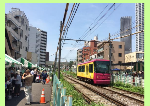
写真：「東池袋4・5丁目地区81まちづくりフェスタ！2018」の様子