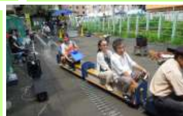
写真：「東池袋 4・5 丁目地区 81 まちづくりフェスタ！2013」の様子