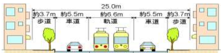
◆補助第 81 号線の整備イメージ断面図